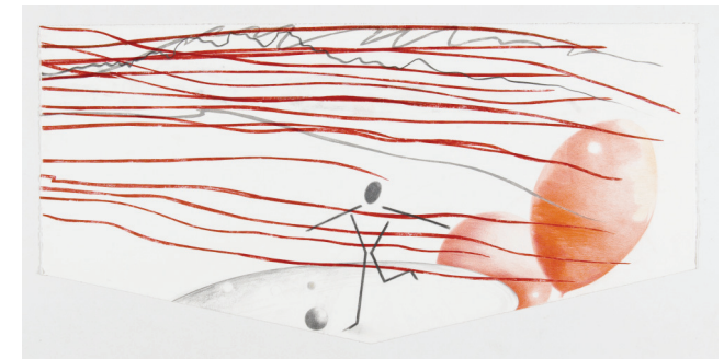
Ohne Titel, 2009 Tusche, Farbstift, Bleistift 53 x 99 cm