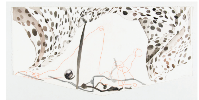
Ohne Titel, 2009 Tusche, Aquarell, Farbstift, Bleistift 53 x 99 cm