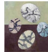
Öl auf Leinwand, 2008 70 x 65 cm