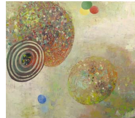
Öl auf Leinwand, 2008 160 x 130 cm