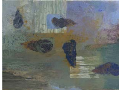
Öl auf Leinwand, 2005 120 x 160 cm