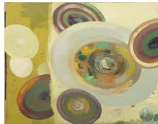
Öl auf Leinwand, 2008 100 x 130 cm