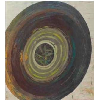
Öl auf Leinwand, 2007 150 x 130 cm